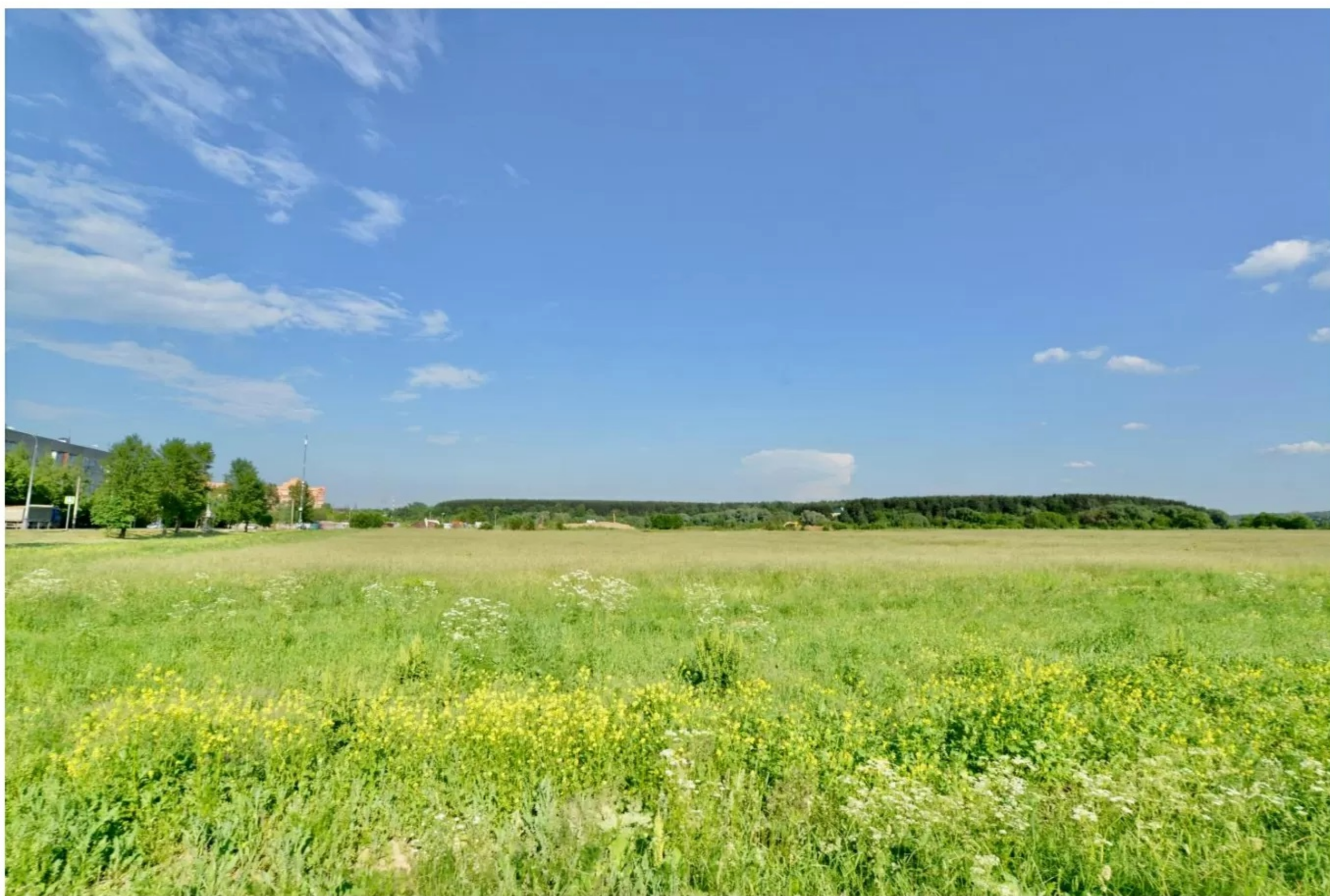
Земельный участок до установки забора и паспорта объекта (информационного щита)